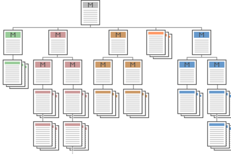
Şekil 10 Dengeli Menü Yapısı

Kamu kurumları internet sitelerinde site içi dolaşım sistemlerinin dengeli yapıda olmasına gayret gösterilmelidir. Kamu internet sitelerinde yer alan tüm sayfalar en az bir başka sayfaya bağlantı içermelidir. Her sayfa hiyerarşik yapıda bir üstünde olan sayfaya ya da ana sayfaya bağlanabilmelidir. Başka hiçbir sayfaya bağlantı içermeyen sayfalar “Çıkmaz Sokak” (Dead-End) olarak adlandırılır ve kullanıcı bu sayfalardan ancak tarayıcının sağladığı geri dönüş imkanıyla ayrılabilir. Kamu internet siteleri Çıkmaz Sokak içermemelidir.