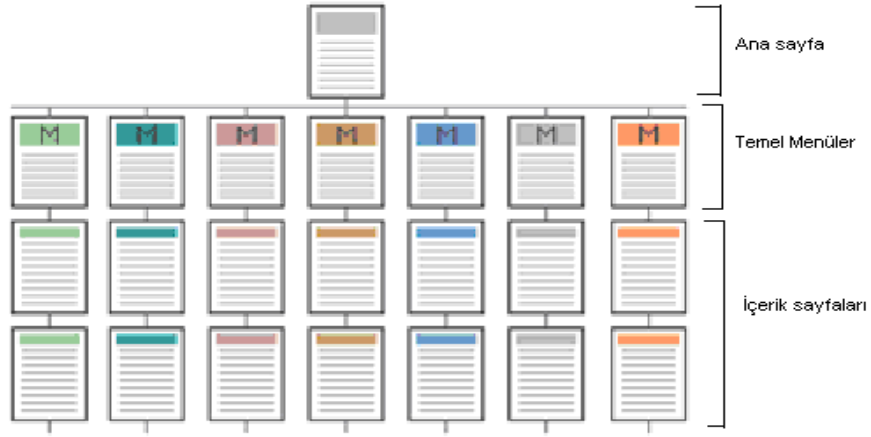
Şekil 1 Bilgi Yapılandırması

Site içinde sunulan bilgiler mantıksal anlamda tutarlı olacak şekilde organize edilmeli ve önem düzeyi de dikkate alınarak yapılandırılmalıdır. Şekil 1 'de örnek bir bilgi yapılandırılması verilmiştir. Bu yapı düzenli olup, her dokümanın kolay bulunabilmesini ve kolay geri dönüş imkanı sağlamaktadır.