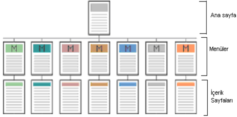
Şekil 6 Hiyerarşik Yapı

Aşağıdaki grafik bu dört tip yapılandırmanın çeşitli kriterler açısından karşılaştırmasını yapmaktadır. Grafikte yatay eksende ilerledikçe anlaşılma zorluğu artmakta buna karşın esneklik kazanılmaktadır. Dikey eksende ilerlemek ise karmaşıklığı artırmakta, kullanıcı bilgi düzeyinin artmasını gerektirmektedir.