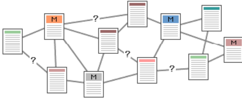
Şekil 2 Karmaşık yapı

Şekil 2 'de ise asla kurulmaması gereken bir bilgi organizasyonu gösterilmektedir. Bu örnekte, mantıksal bölümlenme yapılmamış, bağlantılar gelişigüzel verilmiştir. Sağlıklı dolaşım imkanı yoktur.