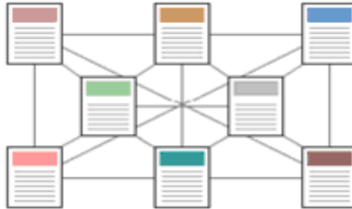
Şekil 5 Ağ Yapısı

Bu yapı getirdiği erişim kolaylığının yanında, karmaşıklığı artırmakta ve bakımı zorlaştırmaktadır.