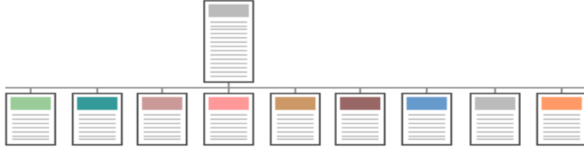
Şekil 8 Sığ Menü Yapısı

Hiyerarşik kademelerin iyi tanımlanmadığı, tüm site içeriğine doğrudan ana sayfadan bağlantı verilen yapılardır.