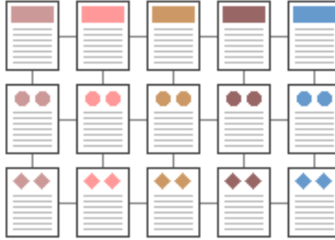
Şekil 4 Izgara Yapısı

Kullanılan bilgi organizasyonu türlerinden biri de Izgara Yapısı'dır. Bu yapıda dokümanlar arası bağlantılar bir ızgara yapısı şeklinde kurulur. Bağlantılar Bilgi Dizisi'nde olduğu gibi tek boyutlu olmayıp, her doküman tüm komşularına bağlantı içerir. Bu tür bir yapının kurulması, bazı kullanıcılar için anlama ve kullanma zorluğu yaratabilir.